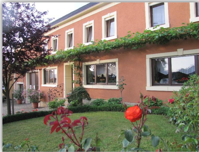
Weingut & Brennerei Peter Greif